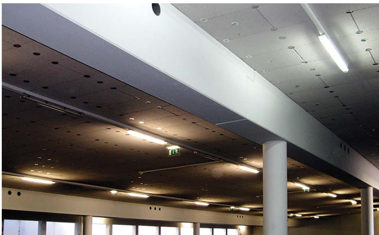
3i - stropní izolační desky dodatečná montáž hmoždinami